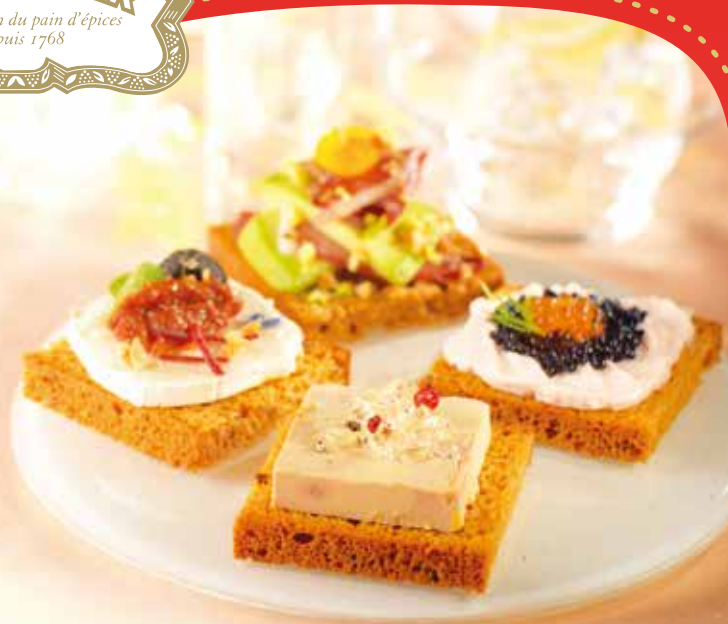
Pain d'épices Raisins / Rhum Réf. : 23019