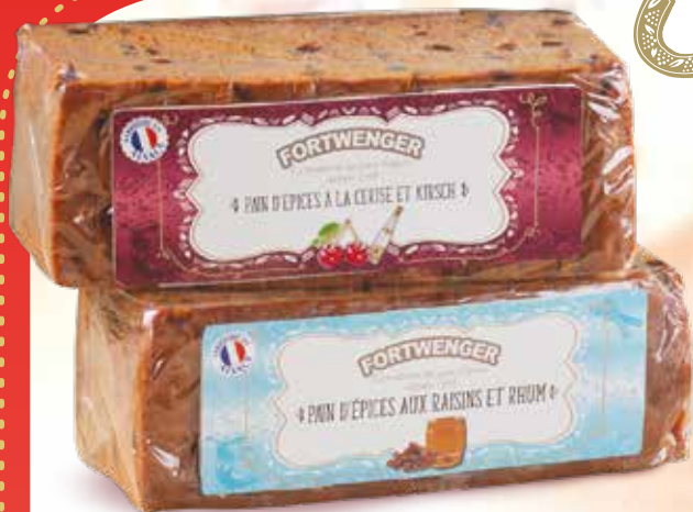
Pain d'épices Cerise / Kirsch Réf. : 23020